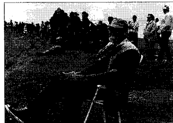
Une journée qui attire un public parfois irrespectueux de la sécurité.